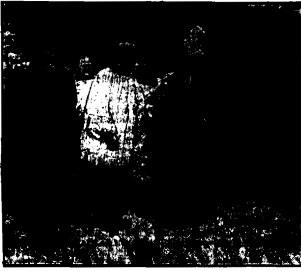
Biskup polowy ks. Gałk kropi trumny poległych