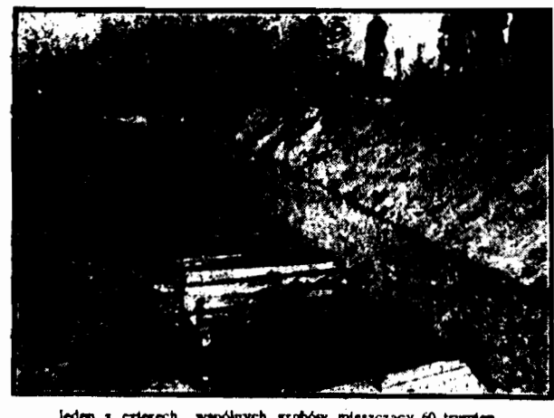
Jeden z czterech wspólnych grobów mieszczący 60 trumien.